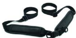
Cinturón pélvico peq.