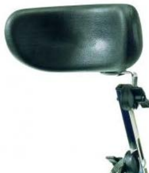
Reposacabezas multifuncional pequeño, de poliuretano