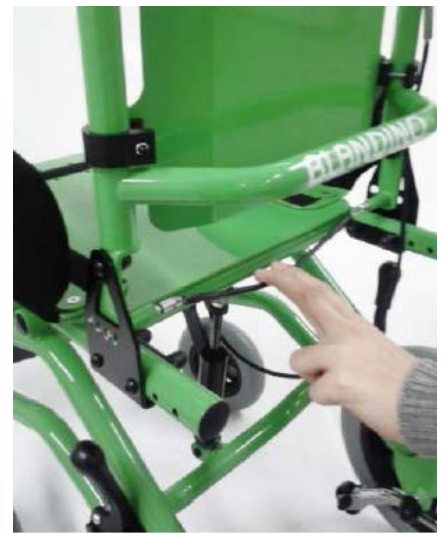
Respaldo de liberación rápida