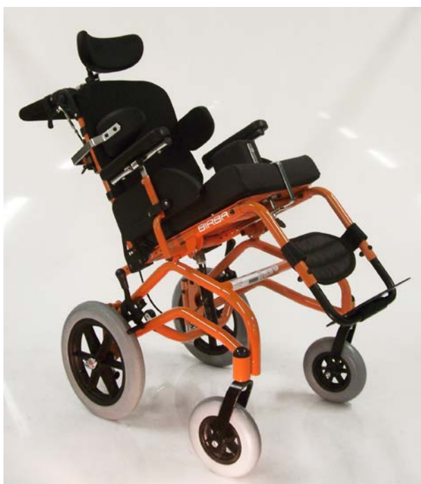
Birba en posición de basculación de 45°

Silla multifuncional de chasis de acero.