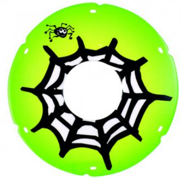
Protector de radios Spider 22"