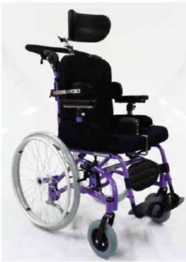
Con ruedas de 22"