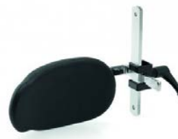
Control de tronco