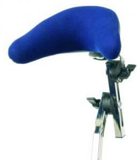
Reposacabezas multifuncional con occipital acolchado